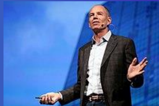
Reed Hastings y Marc Randolph (Netflix,...)